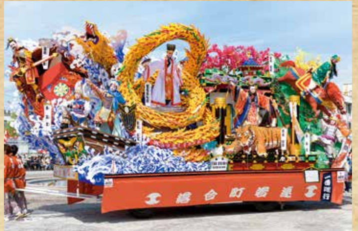
※最優秀山車はふるさと歴史センターに展示しています。