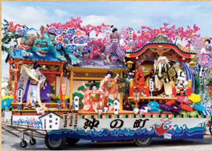
平成27年歌舞伎部門最優秀山車