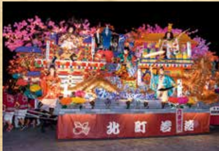
平成27年ゆめりあ展示山車