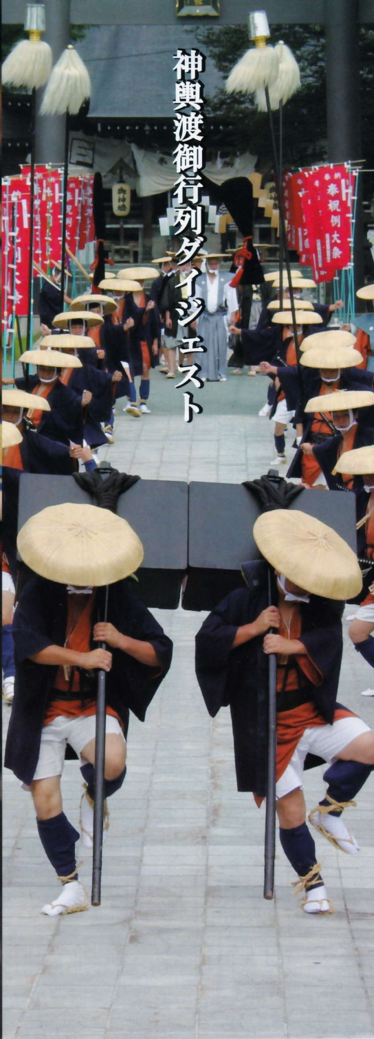
神輿渡御行列ダイジエスト